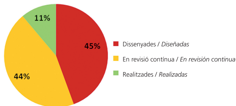
Figura 2. Situació de les accions: percentatge del grau d'implementació / Situación de las acciones: porcentaje del grado de implementación

El grado de implementación está directamente vinculado a la fase inicial en la que se encuentra el Plan.