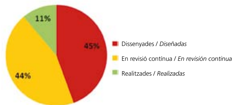
Figura 2. Situació de les accions: percentatge del grau d'implementació / Situación de las acciones: porcentaje del grado de implementación

El grau d'implementació està directament vinculat a la fase inicial en què es troba el Pla.